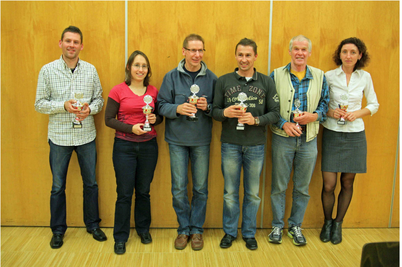
Die obb. Duathlon-Meister